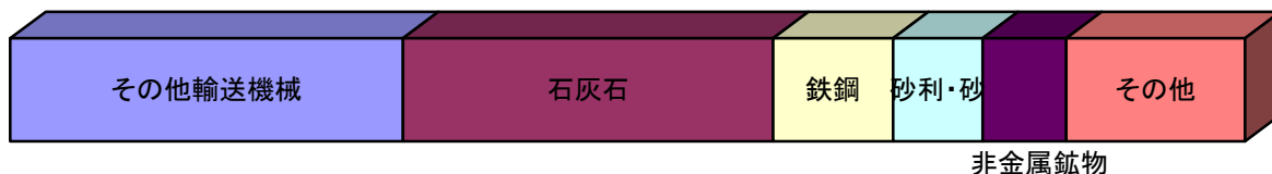
■移入貨物主要品種別表