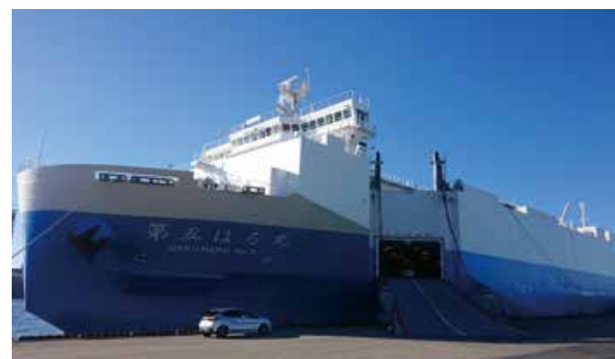
貨物搬入の様子 Freight Loading

※RORO船とは、「ROLL ON・ROLL OFF」の略で、ランプウェイを備え、トレーラーなどの車輛を収納する車輛甲板を持つ貨物船