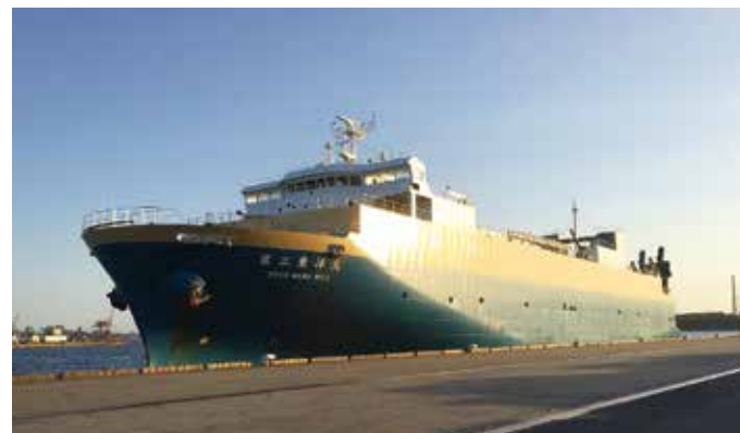
RORO船 RORO ship

Shipment via Scheduled Domestic RORO Routes