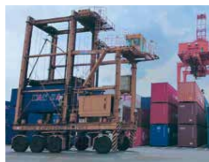
ストラドルキャリア Straddle Carriers

The Chiba Port operates its container terminal as an international logistics hub in Tokyo Bay, supported by its convenient location within the Tokyo metropolitan area, an extensive transportation network, and logistics demand from the Keiyo Industrial Zone in the bay. Current upgrades to the terminal—with various facilities to further enhance its cargo handling capacity and provide seamless transportation—positions the port at the forefront of international logistics services.