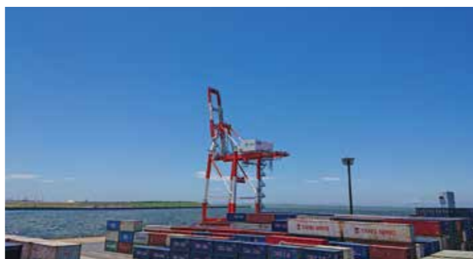
コンテナヤード The Container Yard