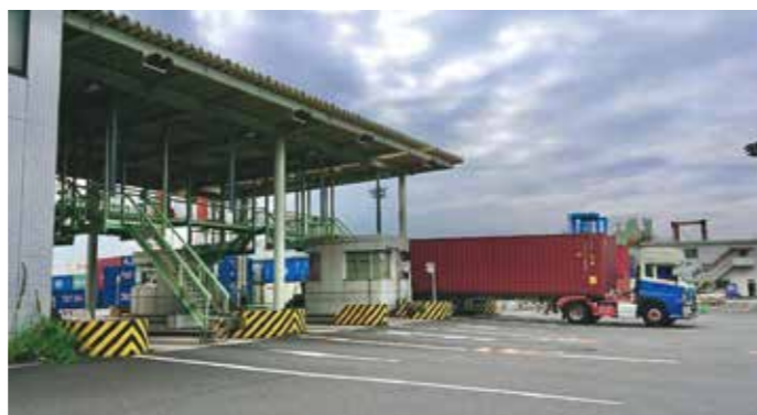
コンテナゲート Container Gate