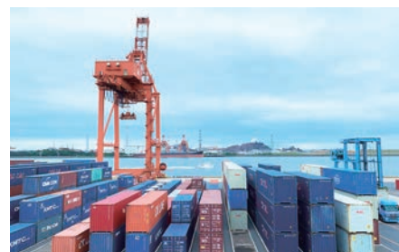
コンテナヤード The Container Yard

Those containers connect the ports of Asia to Chiba, and the Chiba Central Container Terminal lies at the heart of that connection.