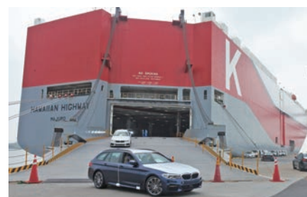
自動車荷役の様子 Unloading a Car

Chiba Port serves as a base for the import of both domestic and foreign manufactured automobiles as well as the export of domestic manufactured automobiles. Automobiles produced all over the world are accumulated at this port and transported to various parts of the Tokyo metropolitan area.