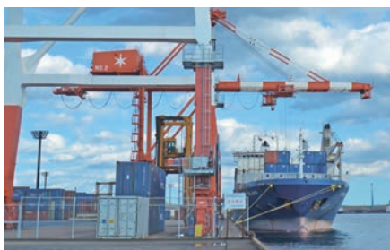
ガントリークレーン Gantry Crane