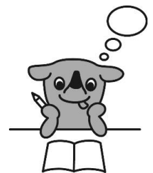
千葉県マスコットキャラクター チーパくん