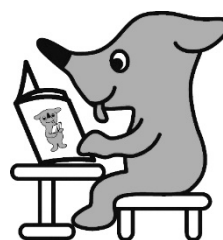
千葉県マスコットキャラクター チーバくん

千葉県 総合企画部報道広報課 広聴室 〒260-8667 千葉市中央区市場町1番1号 電 話 043-223-2469 (平日 9:00~17:00)