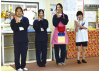
エプロンシアターを披露

県内の県立高校で初めて「保育基礎コース」を設置した市川南高校。保育に携わる仕事を志す生徒が、講義や実習を通じて、日々学びを深めています。 折り紙やピアノ、絵本の読み聞かせといった保育技術を基礎から丁寧に学び、実習で実際にこどもたちと触れ合いながら繰り返し技術を磨くことができるため「仕事が苦手…」「ピアノの経験がない」という生徒も安心です。