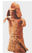
武人埴輪 (山武市小川崎台3号墳)