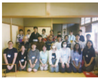
部活動を通じた国際交流(茶道部)

海外に連携校を持つなど国際交流の取り組みが盛んな土気高校では、さまざまな国に関する文化体験や交流会を行っています。各国の伝統工芸・郷土料理作りなどの体験を通して、多様な文化を理解する豊かな心が育まれています。