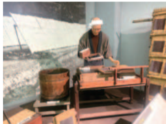
ノリつけの様子(展示)

君津市漁業資料館では、上総ノリ誕生までの甚兵衛の苦労や、ノリづくりに関する資料を展示しています。製鉄の街として発展する以前の、君津の海の歴史を学んでみませんか。