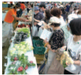
八街産の野菜がたくさん

八街産「千葉半立」などの落花生のほか、新鮮野菜や加工品を販売します。大粒品種の「おおまさり」は、ゆでると特に絶品!試食もあるので、ぜひご賞味ください。八街中学校吹奏楽部の演奏や、やちまたPR大使「落花生娘」のライブなど、ステージイベントも予定されています。