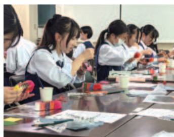
韓紙は厚みがあり独特の手触り

7月に実施した韓国文化体験会では、韓国人の講師から歴史や食文化などの講義を受けました。また、伝統工芸も体験。小さなコッシン(花の靴)の型に色鮮やかな「韓紙」を貼り合わせ、伝統的な色遣いを学びました。