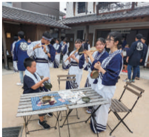
お客さんと一緒に楽しみました