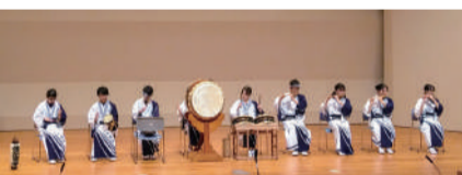
佐原文協祭での演奏

10月には文化交流として、アメリカでの演奏も予定されているとのこと。これから国内外のたくさんの人たちに、佐原囃子の魅力を伝えていきます。