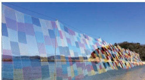
五十嵐靖晃《そらあみ(島巡り)》 (瀬戸内国際芸術祭2019)

県立美術館の広大な展示空間を生かした作品のほか、千葉ポートパークやJR千葉みなと駅近くの「さんばしひろば」など、各所にアート作品が登場します!