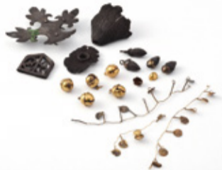
出土した金の鈴は国の重要文化財

市内の県指定史跡「金鈴塚古墳」の出土品を多く展示しています。金鈴塚古墳は6世紀後半に造られた前方後円墳で、博物館の名前の由来となった金色に輝く鈴や、装飾付大刀、装身具類などが発掘されました。