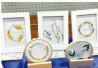
文化祭での作品展示

九十九里高校は、生徒の多様な進路希望をかなえるためのコース制授業が充実しているのが特徴です。2年生から5つのコースに分かれ、共通の授業の他にコースごとの専門的な授業を受けることができます。