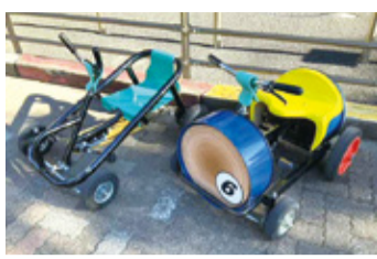
さまざまな乗り物で遊べる

子どもたちが楽しみながら交通ルールを身に付けられる公園です。自転車や一輪車のほか、バッテリーカー、大人と一緒に楽しむ大型四輪車など、さまざまな乗り物に乗ることができます。動物広場では、ポニーやモルモット、カピバラ、カンガルーにも会えてまるでミニ動物園のようです。