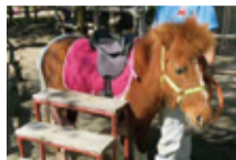
動物との触れ合いも

屋内の体験学習施設も充実しており、雨の日も安心です。運動遊具を使って遊んだり、生物展示ホールで魚類・爬虫類・小動物の観察も楽しめます。