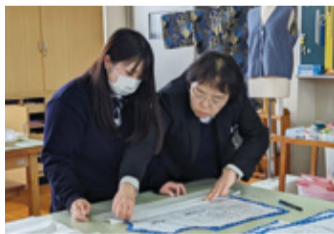
接着芯の貼り方を先生と確認

4月中旬、3年生はブラウス製作の実習で「芯貼り」に挑戦。みんなで教科書の内容を復習し、アイロンの当て方など具体的な作業のコツを習得しました。