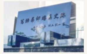
葛飾県印旛県史跡