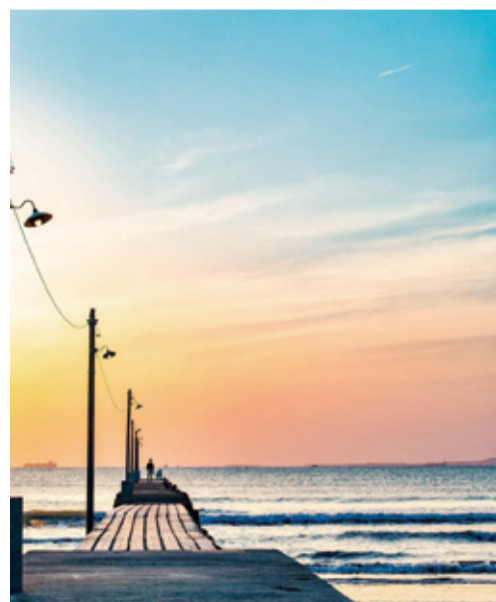
シーズン12投稿写真

ラブちば公式サイト内の「ラブちば優待証」の画面をスマートフォンやタブレットで提示すると、県内約200カ所の観光施設やお店で、各種割引やプレゼントなどのサービスが受けられます。