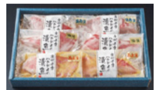
金目鯛漬魚の詰合わせ