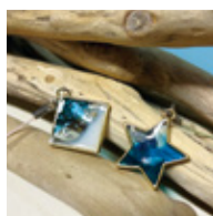
アート体験コーナー (レジニアート)