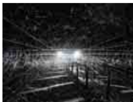
「Analemma2023」(千田泰広 ※牛久リ・デザインプロジェクト(2023年)出展作品)

※前売り期間 3月22日(金)まで ※県内の小中学生は無料引換券を配布。小学生未満は無料。 ※障がい者手帳などをお持ちの方と介護者1人は無料。