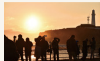
犬吠埼の初日の出