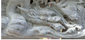
八坂神社 向拝彫刻