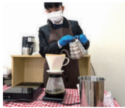
コーヒーサービス