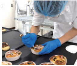
本格的なパン作り

湖北特別支援学校には普通科と流通サービス科があり、生徒の個性を大切にしながら社会自立を支援しています。流通サービス科 食品・サービスコースでは、製パンや製菓のほか接客サービスを学ぶことができ、実習として校内に「手づくりパン Honnête」を開店。おいしいパンやお菓子が地域の方に大人気です。