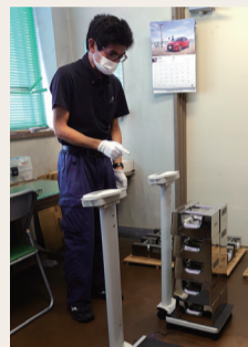
体重計の検定の様子

計量器にもいろいろありますが、例えばスーパーで使用するはかりや病院で使用する体重計など、取引または証明に使用されるはかりは、都道府県などの定期的な検査が必要です。またガソリンスタンドなどでは、検定を受けた計量器に検定証印と有効期限を記したステッカーが貼られています。千葉県計量検定所では、こうした計量器の検定や検査を行っています。