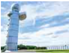
展望塔から海を眺めてリフレッシュ

毎月第1土曜日には、イベント「そでがーでん」をさまざまなテーマで開催。野菜の直売やグルメ、手作り雑貨・アクセサリなどの出店をはじめ、お子さまも参加できる体験教室、音楽やダンスのステージパフォーマンスなど、わくわくする催しが繰り広げられます。