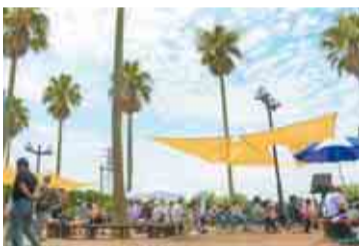
地元出店者の方たちとの触れ合いを楽しんでみませんか

南国風のヤシの木が並び、潮風が心地よい、東京湾に面する親水公園。ピクニックにぴったりの芝生広場が広がり、高さ25mの展望塔からは晴れた日には富士山や東京スカイツリーも望めます。