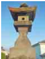
高さ4mを超える立派な常夜灯

製塩と船運で栄え、寺社の町でもあった市川市行徳。みこし造りは地場産業でした。市川市行徳ふれあい伝承館では、国登録有形文化財である旧浅子神輿店店舗兼主屋を活用して、みこしや祭りなど行徳の歴史や文化に関する貴重な資料を展示しています。