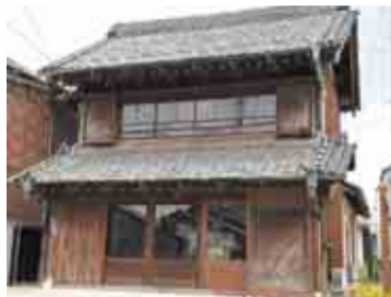
趣のある旧浅子神輿店店舗兼主屋

近隣には江戸時代に航路の安全祈願のために建てられた常夜灯が残る常夜灯公園や、行徳神輿ミュージアムも。歴史散歩を楽しんでみませんか。