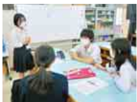
一から授業を組み立てます

他にも、学校掲示板に張り出す掲示物の作成や生徒自身で立案した模擬授業を実施するなどの教員体験をすることで、教育への関心を深め職業意欲を育てています。