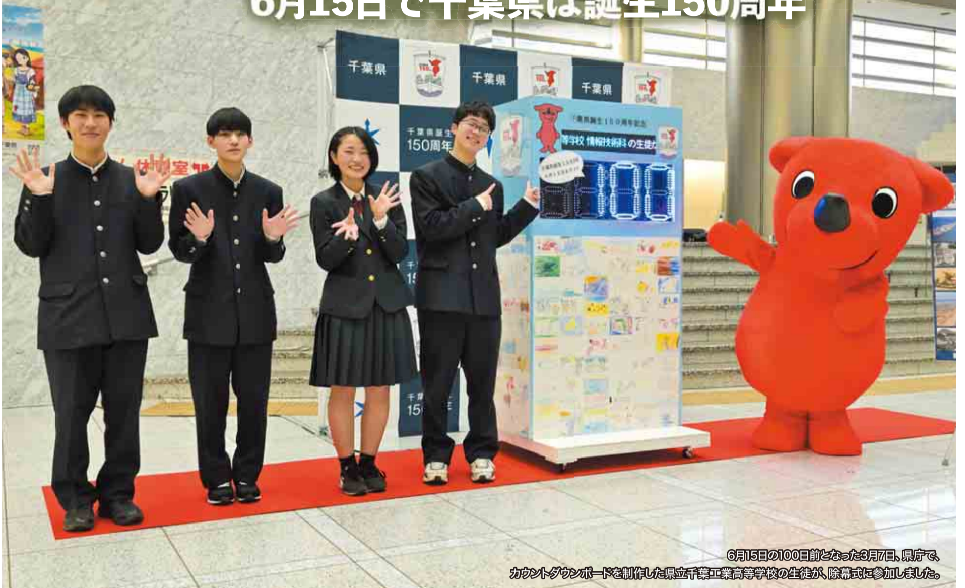
6月15日の100日前となった3月7日、県庁で、カウントダウンボードを制作した県立千葉工業高等学校の生徒が、除幕式に参加しました。