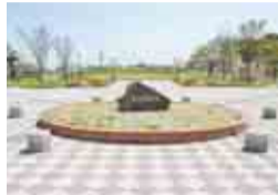
総面積7.8%の開放的な公園

「今井の桜」や「桜台地区の桜並木」など、桜の名所が多数ある白井市。白井市役所裏通りの桜並木と、隣接する白井総合公園も、そのうちのひとつです。