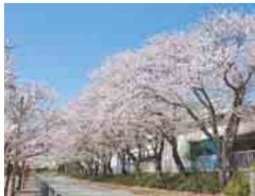
市役所前の桜並木

ソメイヨシノが植栽された白井総合公園の園路は、春になるとお花見に訪れる方々にぎわいます。芝生広場ではレジャーシートを広げてくつろぐことができたり、全長15mのローラー滑り台や複合遊具で遊べたりと、地域の憩いの場となっています。