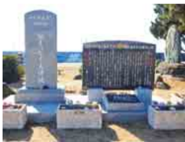
津波を伝える石碑が市内に建てられています

2011年の東日本大震災で津波の被害を受けた旭市で、その甚大な被害の記憶を後世に伝える防災資料館。最大の津波が到達した17時26分で止まったままの「忘れじの時計」や避難所生活を再現した模型など、風化させてはいけない震災の記憶と共に、震災後の風評被害や復旧・復興の歴史が写真や映像・実物資料で展示されています。