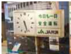
津波で被災し止まったままの時計

2011年の東日本大震災で津波の被害を受けた旭市で、その甚大な被害の記憶を後世に伝える防災資料館。最大の津波が到達した17時26分で止まったままの「忘れじの時計」や避難所生活を再現した模型など、風化させてはいけない震災の記憶と共に、震災後の風評被害や復旧・復興の歴史が写真や映像・実物資料で展示されています。