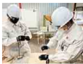
現場のプロからの指導を受けます

京葉工業高校では、「ものづくり」を通して、社会で求められるような生徒の育成に取り組んでいます。