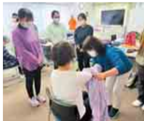
上着着衣の介助演習