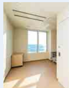
◀海が見える病床も