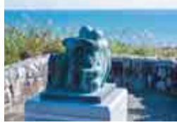
ラファエル・ゲレロ『抱擁』

1609年、ドン・ロドリゴ総督を乗せたスペイン船サンフランシスコ号がメキシコへ向かう途中、岩和田(現田尻海岸)沖に座礁。海に投げ出された300人以上の乗組員に、御宿の村人たちが着物や食料を分け与え、助けました。