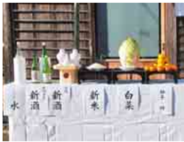
新酒や作物などを供える神事

酒々井町の名は、孝行息子が父親のためにくんだ井戸水が酒になったという「酒の井」伝説に由来します。お酒と縁の深い町で開催される、年に一度の大祭が酒々井新酒祭です。