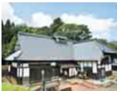
江戸時代から続く酒蔵

甘酒や酒造りに使われる天然地下水を試飲できる他、和太鼓や三味線の演奏などのイベントもあり、ご家族そろって楽しめます。