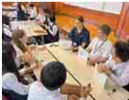
英語でゲームの説明に挑戦!

9月下旬に、オーストラリアの姉妹校の生徒が来日し、一緒にカードゲームや日本の昔遊びなどをして交流しました。また、複数の生徒が自宅でホストファミリーの受け入れをして、日本の「日常」を一緒に味わいました。