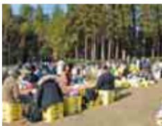
広々とした芝生の飲食スペース