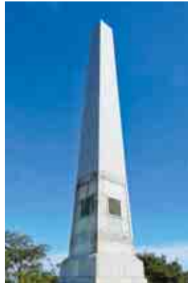
丘の上に立つ記念碑

この出来事をきっかけに日本、スペイン(西)、メキシコ(墨)の交流が始まったことから、上陸地近くの丘に記念碑が建てられました。また、メキシコ政府からは交流400年記念に「抱擁」像が寄贈され、現在も友好関係は続いています。丘の上から海を眺め、決死の救助活動を行った先人たちに思いをはせてみませんか。