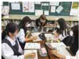
外国人の先生が常駐しています

国際教養科は英語力の向上だけではなく、「国際人」として必要な多方面の知識や考え方などを身に付けていることを目指しています。また、英語でその国の歴史や、自然、文化を学ぶことで教養を深めています。