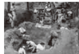
殿塚古墳発掘の様子

1956年に発掘調査が行われ、姫塚古墳から人物や馬などの多彩な形象埴輪が原位置の列のまま出土するという大発見となりました。発掘作業は芝山仁王尊・観音教寺と早稲田大学を中心に、地元住民が多方面から協力し、まさに地域ぐるみの発掘でした。「埴輪の町」として知られる芝山町では、毎年11月の第2日曜日に「芝山はにわ祭」が開かれます。