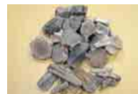
沖ノ島遺跡から出土したイルカの骨

普段は海面下に沈んでいて、干潮時にだけ砂浜に現れる沖ノ島遺跡。この特殊な状況のため、1987年に発見されるまで未知の遺跡でした。2003年～05年にかけて調査が行われ、縄文時代早期の土器や石器の他、イルカの骨が大量に見つかりました。このことから沖ノ島遺跡はイルカ猟の拠点であったと考えられています。