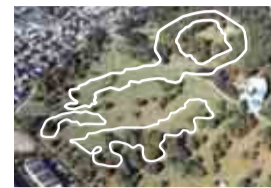
白線の位置に貝層があります

加曽利貝塚では1924年に初の本格的な調査が行われました。ドーナツ形をした縄文時代中期の北貝塚と、馬のひづめの形をした縄文時代後期の南貝塚からなる、日本最大級の貝塚です。2017年には、県内で唯一かつ貝塚として初めて国の特別史跡に指定されました。