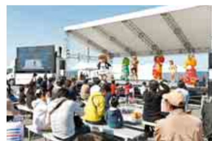
キャラクターステージは大盛り上がり