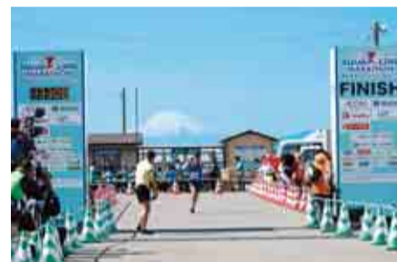
ランナーのゴールを見届けよう