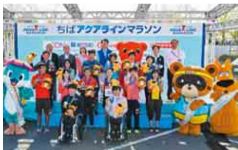
表彰式は14時ごろから(予定)