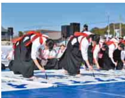
書道部の応援パフォーマンスは毎回大好評