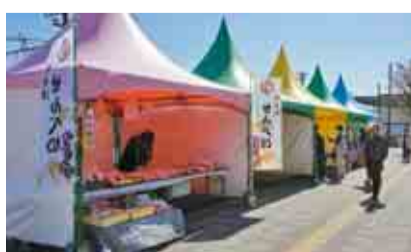
名産品の出店が並びます

お土産の販売を行います。ブルーベリーやのり、アサリ商品など、木更津の名産品をぜひ手に入れてください。