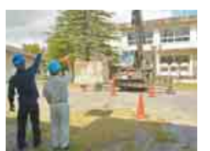
講習会に取り組む生徒

講習会を通して、生徒たちは建設についての興味をさらに深め、進路選択に生かしていきます。