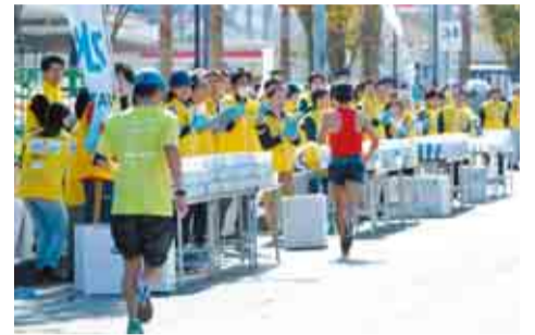
ボランティアの活躍がランナーを支えます