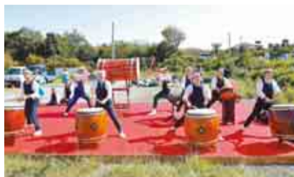
迫力のある和太鼓の演奏で応援