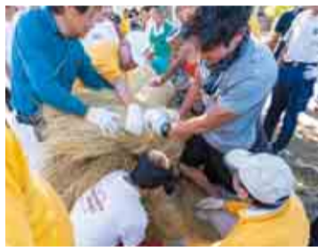
巨大なしめ縄を1日で作り上げます

赤城神社が鎮座するおわんを伏せたような小山は、その昔、上州(群馬県)の赤城山の土の塊がここに流れ着いてできたという伝説があり、山が流れてきたから「流山」という地名が付いたといわれています。(流れてきたのは赤城山のお札だという説もあります。)