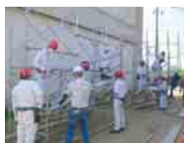
足場組み立ての実習

東総工業高校の建設科では、2年生から土木コースと建築コースに分かれて、暮らしを支える土木や建築に関するさまざまな知識や製図の技能などを学びます。