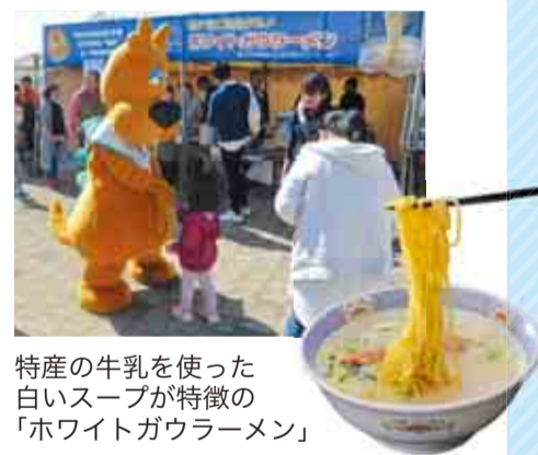
特産の牛乳を使った白いスープが特徴の「ホワイトガウラーメン」

※「ゆりまち袖ヶ浦駅前モール」内の「天然温泉 湯舞音」でも、ランナーにすてきな特典をご用意しております。