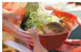
自慢のグルメを召し上がれ