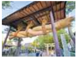
重さは約500kgもあるといわれています

10月9日(日)には、流山市指定無形民俗文化財となっている大しめ縄行事を開催予定。地元住民が力を合わせて青竹を芯に3本の巨大な縄を作り、これをさらにねじり合わせて大しめ縄を完成させます。大迫力の行事を間近で見たい方は、