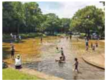
暑い日差しの中、水遊びが気持ち良い

問い合わせ・バーベキュー予約 香澄公園管理事務所 TEL047-454-1823