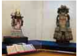
広常の伝説にまつわる品々を展示 〔左:小桜威勝丸(千葉市立郷土博物館所蔵) 右:明黄威勝丸(玉前神社所蔵)〕

現在、特別展「源平争乱を生きた上総広常の時代と伝説」を開催中(令和5年1月8日まで)。当時、上総国と呼ばれた千葉県中部で最大勢力を誇った武将広常の数々の伝説を通して、平安時代末期から鎌倉時代初期ごろの房総を再発見してみませんか。