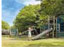
体を動かして遊ぼう

谷津干潟の保全、湾岸道路や工場群の公害防止などのために造られた全長1200mの細長い公園。緑豊かな園内には散策路が設けられ、散歩やジョギングを楽しむ人も多く見られます。