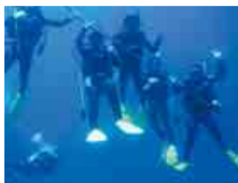
実習でのダイビング

大原高校の海洋科学系列では、外房の海で主に資源増殖の分野を学んでいます。沿岸漁業が盛んな地域で暮らしている生徒たち。水産資源がもたらす恩恵をじかに感じているからこそ、海への思いもひとしおです。