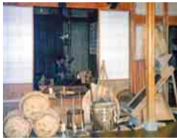
昔の暮らしをリアルに再現