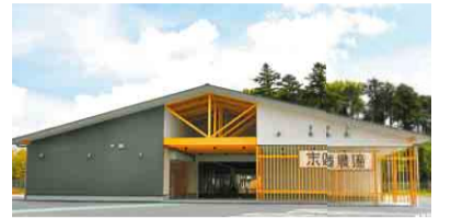
「大正浪漫」をイメージした外観