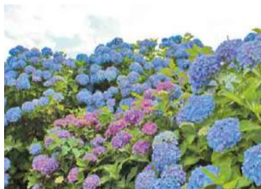
満開のアジサイを楽しもう

房総半島のど真ん中に位置するこの公園では、地元の方々が年月をかけて桜やアジサイを植え、美しい景観を整備してきました。これからの季節は、色とりどり1700株のアジサイが見頃を迎えます。