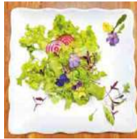
彩りある食用花を使ったサラダもあります

大正〜昭和時代にこの地にあった先進的な農場の名を引き継いだ、富里市初の観光・交流拠点施設が完成しました。飲食スペースではかつての末廣農場由来の希少な豚肉や、末廣農場とゆかりのある「小岩井農場」のソフトクリームなどがおすすめ。物販コーナーには「富里スイカ」をはじめとした地元の新鮮な野菜や果物などが並びます。イベントスペースや観光案内もあり、楽しみ方はいろいろ。隣接する、当時の風景を残した旧岩崎久彌末廣農場別邸公園も訪れて、富里農業の歴史に思いをはせてみませんか。