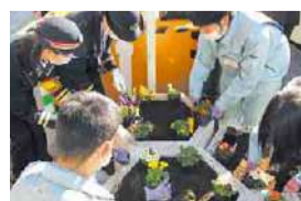
JR本八幡駅の花壇の美化活動(園芸コース)

開校以来大切にしていることは、地域とのつながり。実践型の学習の他にも、授業で育てた植物を近くの駅前の花壇に植えるなど、さまざま