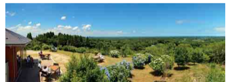
九十九里浜から茂原市街まで一望できる

公園内の展望カフェでは、晴れた日には遠く東京スカイツリーや太平洋まで見渡せることも。自家焙煎コーヒーや地元の食材を使ったスイーツを味わいながら、花々と絶景を満喫してみませんか。