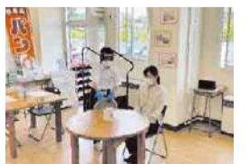
校内のカフェで接客を練習する生徒

また、6月12日(日)に幕張メッセで開催される県民の日記念行事「ちばワクワクフェスタ2022」では、県立流山高等学園と合同で特設ブースを出展。生活デザイン科の生徒たちが中心となって手作りしたハンドメイドの布小物を販売します!