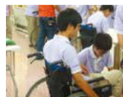
キャリア教育と職業教育の充実