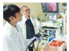
探究的な学びの推進