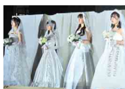
ファッションショーでドレスを披露(洋裁コース)

佐倉東高校の服飾デザイン科では、1年次からアパレルCAD(製図ソフト)やファッション業界の仕組みなどの基礎を習得。2年次からは和裁コースか洋裁コースを選び、3年次に振り袖やウエディングドレスの製作などを行います。