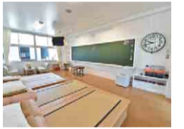
教室を改装した客室

校舎の2階は宿泊施設。黒板やロッカーなど、昔懐かしい教室の面影が残る客室でユニークな宿泊体験ができます。家族と一緒に、「学校」に泊まってみませんか。