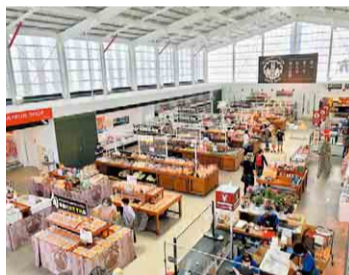
高い天井に体育館の面影が残る

廃校となった小学校をリニューアルした道の駅。体育館を改装した直売所では、地元の朝採れ野菜やお花などを販売。教室を改装したレストランでは、懐かしい給食や本格石窯焼きのピザなど、多彩なグルメが楽しめます。