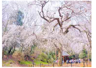
見事な枝ぶりのしだれ桜