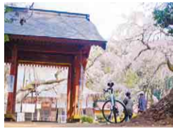
福星寺門と土塁跡

中世の城址でもある福星寺。巨大な土塁跡や空堀が残る境内に入ると、幹回り3.3m、高さ14mのしだれ桜が姿を現します。樹齢は約400年。廃城跡に福星寺を創建する際、徳川家康が手をかけて称えた「お手かけの桜」から株分けされたといわれています。枝いっぱい花を付けたしだれ桜はため息が出るような美しさ。歴史ある境内で、春の訪れを感じてみませんか。