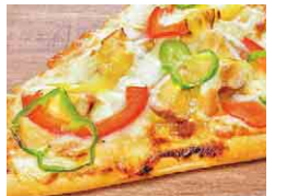
地元のもろみ味噌をソースにしたピザ

レストランや茶房でも、地元の食材を発酵食品でアレンジしたメニューが人気。「豚肉の味噌麹焼き」や「甘酒糀あんまん」など、こだわりの味が楽しめます。