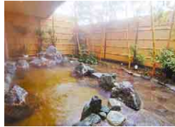
薄く黄色がかった「黄金の湯」

県道30号飯岡一宮線沿いに並ぶ約500本の寒桜。町内各所にも約1000本の桜が植えられ、紅紫色のかわいらしい花が一足早い春の訪れを告げます。温泉地としても有名な白子町。美肌・保湿や、疲労回復効果があるといわれる優しい温度のお湯に、ほっと心が和みます。お気に入りの宿を見つけて、温泉と早咲きの桜にゆっくり癒されてみませんか。