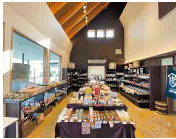
充実した品揃えで県外のファンも多い

江戸時代から発酵・醸造業が盛んな神崎町。道の駅には地元の名産品はもちろん、全国各地から厳選した発酵商品が並びます。甘酒や味噌など伝統的な食品から、発酵ジャムや化粧品など珍しい商品まで、驚きの品揃えです。