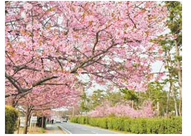
静岡県の「河津桜」を譲り受けて育てた白子の桜