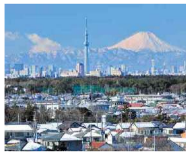
広い空と澄んだ空気に癒される

一般開放されている鎌ヶ谷市役所の屋上は、北総台地の景観を360度パノラマで楽しめるビュースポット。西側に広がる都心のビル群と東京スカイツリー、その隣に富士山が並ぶ景色は絶景です。