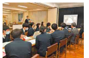
淡水高校の生徒の発表に熱心に聞き入る参加者

会の最後には、両校の関係がさらに深まることとお互いに行き来できる日常が再び来ることを願って、スクリーン越しに記念撮影を行いました。