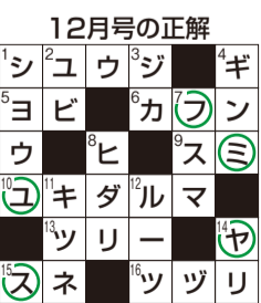
フユヤスミ(冬休み)

(住所記載不要) 県報道広報課クイズ係へ応募は1月1日通まで。締め切りは1月17日(必着)。正解者の中から抽選で20人に「房総真鯛と黄金鯨のお茶漬けセット“彩”」を贈呈。当選者の発表は発送をもって代えさせていただきます。また、いただいたご意見などは今後の編集の参考にさせていただきます。12月号の正解者数は4468人でした。