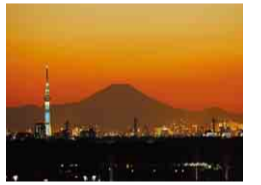
富士山とライトアップしたスカイツリー

この時期は開放時間が延長されているため、夕暮れ時から夜景を楽しむのもおすすめ。2月と11月には富士山頂に夕日が重なるダイヤモンド富士も見られます。