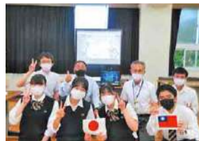
スクリーン越しの記念撮影

流山高校では、台湾にある新北市立淡水高級商工職業学校と交流し、グローバルな視点と異文化理解の重要性を学んでいます。以前は、修学旅行などで両校の学生が実際に行き来していましたが、新型コロナウイルス感染症が流行してからは、オンライン会議や手紙交換などを行い、関係を深めています。