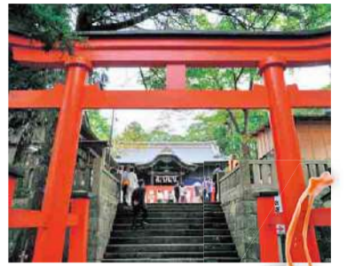
社殿は2017年に大修理が行われた

場所 長生郡一宮町一宮3048 交通 JR外房線「上総一宮駅」から徒歩7分。 九十九里有料道路「一宮IC」から車で10分(無料駐車場80台) 御守りなどの授与 8時～17時(拝観は時間外も可) 問い合わせ 一宮町観光協会 TEL0475-42-1425