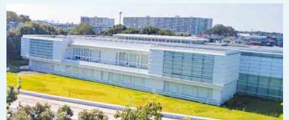
ちばぎん研修センターを複合型施設として活用