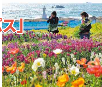
白間津の花畑(南房総市)

※新型コロナウイルス感染症等の影響により、発売の中止や、内容が変更になる場合があります。詳しくはホームページをご覧ください。 サンキューちばフリーパス 検索