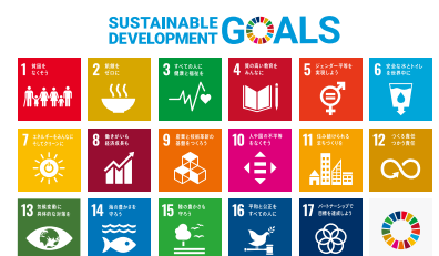
SDGsロゴと17のアイコン

「Sustainable Development Goals (持続可能な開発目標)」の略称です。貧困や不平等・格差、気候変動などのさまざまな問題の解決に向けた世界共通の目標で、地球上の「誰一人取り残さない」ことを誓っています。