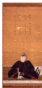
『絹本着色土井利勝肖像画』(正定寺蔵)画像提供…茨城県古河市立古河歴史博物館

場所 佐倉市城内町官有無番地(佐倉城址公園) 【協力・画像提供】 佐倉市教育委員会 TEL043-484-6192