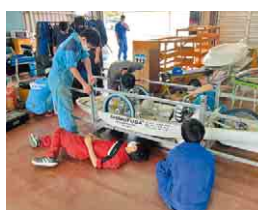
自動車に情熱を注ぐ部員

下総高校の部活動の一つ「自動車部」では、エンジン班やタイヤ班などに分かれ、燃料消費効率の良い車を研究・開発しています。