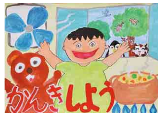
令和3年度事故防止啓発ポスター入賞作品

湯沸かし器、ガスストーブ、ガスコンロなどを室内で使用するときは、一酸化炭素中毒による事故を防止するため、必ず換気をしてください。 ガス機器を使用するときは、換気扇を回したり、窓を開けるなどして新鮮な空気を入れましょう。 問 県産業保安課 TEL 043-223-2729