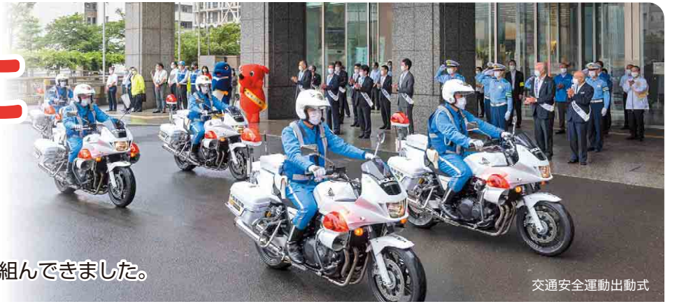
交通安全運動出動式

今年6月、八街市で飲酒運転により児童5人が死傷する事故が発生しました。県と県警では、関係団体や地域の方々の協力のもと道路の安全確保・交通規制の見直しなどを早急に進めるとともに、飲酒運転根絶に向けた啓発活動や取り締まり強化など、あらゆる対策に取り組んできました。私たちは、この事故を、絶対に忘れません。交通事故で、辛く、悲しい思いをする人がいなくなるように県民の皆さまと一緒に、交通安全に向けた取り組みを続けていきます。