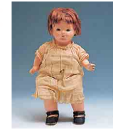
「アリス・プレーブル」