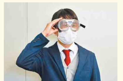
交通安全教室で飲酒体験ゴーグルを活用

近い将来、車やバイクを運転する中学・高校生への交通安全教育にも力を入れています。また、テレビCMや動画の配信、チラシ・ポスターなどによる広報啓発も強化しており、県全体で「飲酒運転を許さない」社会環境をつくっていきます。