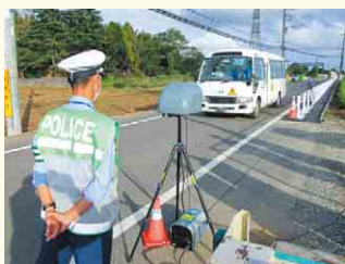
速度違反取り締まりの様子

通学路や生活道路などで、最高速度30kmの区域規制と、路面の一部を盛り上げて速度を減速させる「ハンプ」等を組み合わせた「ゾーン30プラス」を整備。可搬式の数値違反取り締まり装置*を7台追加配備し、通学時間帯を重点に取り締りをさらに強化していきます。