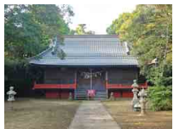
屋形四社神社 本殿

太平洋を望む九十九里浜のほぼ中央に位置する屋形海岸。水平線から昇る太陽が、広い空と海をゆっくりと染め上げていく様子は格別で、隣接する公園「マリニピアくりやまがわ」の展望の丘は、人気の写真撮影スポットになっています。初詣は屋形四社神社がおすすめ。1688(元禄元)年造営の本殿は、九十九里地方屈指の社殿建築と高い評価を得ています。