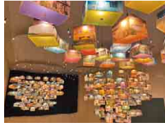
廃校の中に広がるアート空間

小湊鉄道の駅舎や廃校、里山などを舞台に、世界各国のアーティストが約90点の現代アート作品を展示する芸術祭。懐かしい里山の風景と現代アートが融合し、非日常の空間を作り上げます。ホームページでは作品の楽しみ方や巡り方を紹介している他、五井駅・上総牛久駅のインフォメーションセンターなどではガイドブックも販売しているので、アート初心者も安心です。