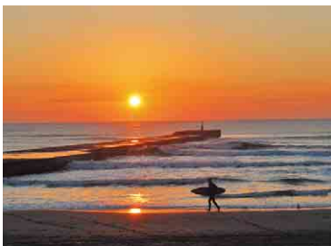
第4回 横芝光町観光フォトコンテスト 特別賞「初日の出」

太平洋を望む九十九里浜のほぼ中央に位置する屋形海岸。水平線から昇る太陽が、広い空と海をゆっくりと染め上げていく様子は格別で、隣接する公園「マリニピアくりやまがわ」の展望の丘は、人気の写真撮影スポットになっています。初詣は屋形四社神社がおすすめ。1688(元禄元)年造営の本殿は、九十九里地方屈指の社殿建築と高い評価を得ています。