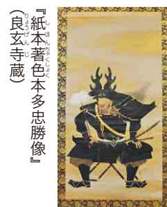
『紙本着色本多忠勝像』(良玄寺蔵)

場所 夷隅郡大多喜町大多喜481