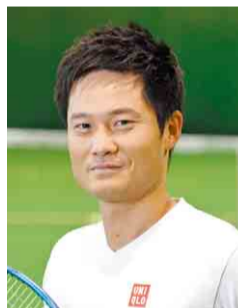
車いすテニス シングルス(金) 国枝 慎吾 選手(柏市出身)

日本選手団の主将として臨んだ東京パラリンピック、関係者の皆様、声援を送っていただいた皆様に心から御礼申し上げます。自分自身が全力のパフォーマンスをすることで、パラスポーツの魅力を伝えたいと思っていましたが、少しでもその思いが伝わっていたら嬉しいです。引き続き、皆さまにはパラスポーツに注目し、関心を持ってもらえれば嬉しいです。