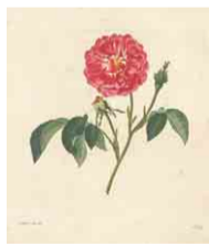
レーシヒ 「バラ彩色図譜」より

料 一般800円、高校・大学生400円、中学生以下・65歳以上・障害者手帳などをお持ちの方とその介護者1人無料