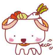
ちばレジ袋削減エコスタイル キャラクター「モラワン」