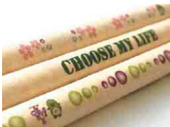
東金商業オリジナル紙ストロー

東金商業高校では、近年問題になっているプラスチックゴミに目を向け、紙ストローの製作・普及を企画。生徒たちが授業で学んだ商業デザインの知識を生かし、東金市に縁が深い桜とブドウを描きました。出来上がった紙ストローは、東金市や商工会議所などの協力の下、地元のサービスエリアやお祭りなどでPR活動が行われ、使ったお客さまからは「意外と丈夫で使いやすい」などの感想をいただきました。