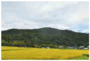
上総富士(大坂富士)

標高がわずかに285坪の上総富士(大坂富士)。現在、その大部分はゴルフ場になっていますが、古墳や