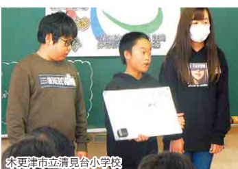
木更津市立清見台小学校

東京2020パラリンピック閉会式で、「I'm POSSIBLEアワード」開催国最優秀賞に木更津市立清見台小学校、開催国特別賞に県立東金特別支援学校が選ばれ、表彰されました。「I'm POSSIBLE」には、「不可能(Impossible)と思えることも、ちょっと考えて工夫すればできる(I'm possible)」というパラリンピック選手たちが体現するメッセージが込められています。バリアフリーについての学びやパラスポーツの普及など、共生社会の実現に貢献する活動が評価されました。