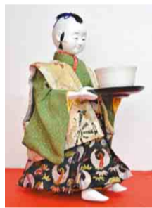
榎本誠治作 「茶運び人形」

料 一般500円、高校・大学生250円、 中学生以下・65歳以上・障害者手帳などをお持ちの方とその介護者1人無料