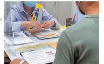
骨髄ドナー登録説明の様子