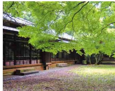
ガラス障子の意匠が美しい主屋