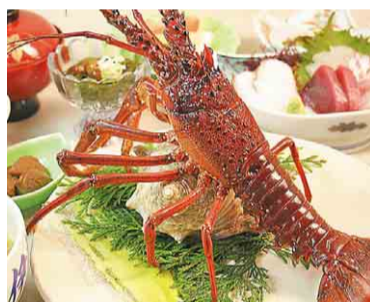
プリプリの新鮮な伊勢えび

千葉県は全国トップクラスの伊勢えびの産地。中でも大原~御宿~勝浦沿岸でとれる「外房イセエビ」は、鮮やかな色合いと濃厚な味わいで市場でも高く評価されています。伊勢えび祭りでは、協賛の飲食店・宿泊施設でオリジナルの伊勢えびメニューを提供。とろけるような甘みのお刺身や、香ばしい香りが食欲をそそる鬼殻焼きなど、各店自慢の味をぜひお楽しみください。