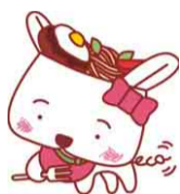
ちば食べきりエコスタイル キャラクター「ノコサー」