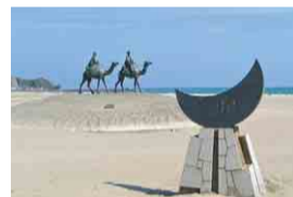
月の沙漠記念公園

千葉県は全国トップクラスの伊勢えびの産地。中でも大原~御宿~勝浦沿岸でとれる「外房イセエビ」は、鮮やかな色合いと濃厚な味わいで市場でも高く評価されています。伊勢えび祭りでは、協賛の飲食店・宿泊施設でオリジナルの伊勢えびメニューを提供。とろけるような甘みのお刺身や、香ばしい香りが食欲をそそる鬼殻焼きなど、各店自慢の味をぜひお楽しみください。