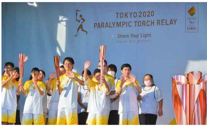
「おりがみ」の学生と特別支援学校の生徒と一緒に聖火をつなぎました

県内の大学生を中心とした学生団体「おりがみ」は、大学生と特別支援学校の生徒が交流する「パラスポーツプロジェクト」を進めてきました。特別支援学校を訪ね、交流会やボランティア活動を生徒と一緒にすることで、生徒がもつ多様な個性や熱意を発信する活動を続けています。 パラスポーツをヒントに 「おりがみ」の学生たちは、最初は障害のある子どもへの支援や関わり方を知らない「素人」だったといいます。注目したのはパラスポーツ。「パラスポーツには障害の大変さや特徴を参加者がわかりやすく体験できる工夫がある」ことに着目し、パラスポーツを参考に、体を動かすあそびを自分たちで考え、交流に取り入れました。 特別支援学校の生徒たちと一緒に開催した運動会では、手作りの玉入れ競争や、ラグビーボールを使ったリレーで、障害の有無や年齢の差も関係なく、みんな一緒に楽しむことができたそうです。