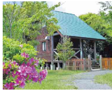
四季折々の自然を感じられる

長柄ダム湖畔で、豊かな緑に囲まれながらバーベキューやテニスなどが楽しめる施設。星空観察会やウォーキングなど、年間を通じてさまざまなイベントも開催されています。夏には子どもに大人気の昆虫ドームがオープン。1,000㎡の敷地内でカブトムシやクワガタを見て、触って、昆虫採集を体験できます。