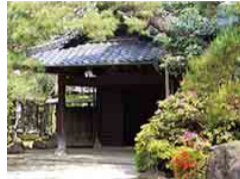
旧邸宅の庭園は国登録記念物

昭和34年に開館した千葉県初の登録博物館。醤油関係の資料が豊富で、全国的にもユニークな展示が特徴です。建物は日本武道館も手掛けた山田守の設計で、中央を吹き抜けとしたモダンな造りは見応えがあります。同敷地内の市民会館は地元の醤油醸造家茂木佐平治の旧邸宅。タイムスリップしたような趣の主屋と茶室、広く風格ある庭園は、ドラマやCMのロケ地としても有名です。