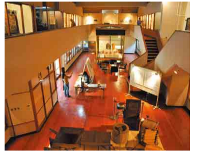
博物館・市民会館の建物は国登録有形文化財。8月末まで収蔵品を特別公開中