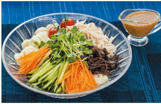
夏の食卓に 棒棒鶏風ぶっかけそうめん