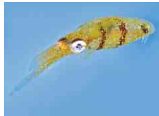
世界最小のイカ「ヒメイカ」

この夏、海の博物館にイカやタコの仲間が大集合! ダイオウイカの親子や神秘的なユウレイイカ、ユーモラスなメンダコや危険なヒョウモンダコなど、さまざまな標本を紹介します。