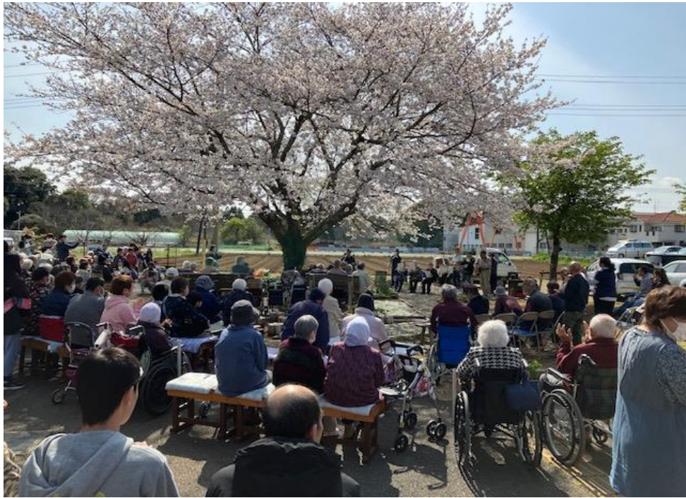
お花見コンサート