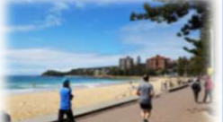
ビーチウォーク (例:オーストラリア)