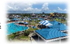
蓮沼ウォーターガーデン