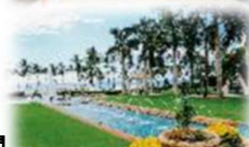
海とつながりのある空間