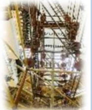
立体アスレチック