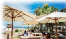
青島ビーチパーク(HP)