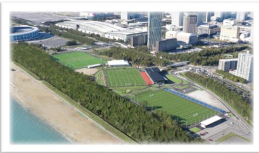
▶ JFA夢フィールド