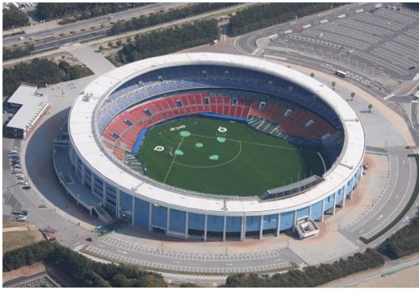
▶ Zozoマリスタジアム (千葉マリスタジアム)