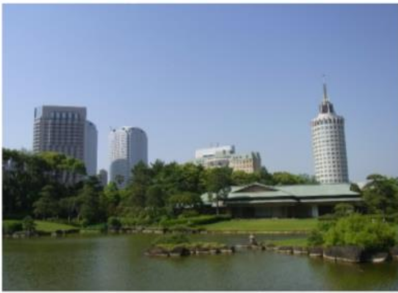
▶ 見浜園・茶室 (松籟亭)