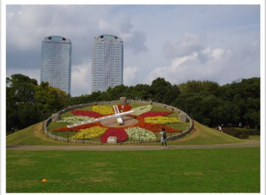
▶ 大芝生広場・花時計

スポーツと緑が融合するブロックです。多目的利用できる「芝生広場」や、サイクルレジャーが楽しめるマウンテンバイクコースがあります。