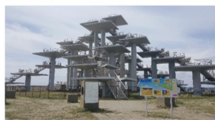
▶ 明治百年記念展望塔

コンサートや各種イベントに利用できる野外劇場や、子どもたちが野外活動を楽しむキャンプ場もあります。