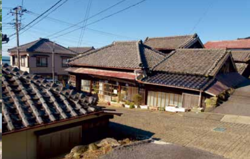
写真は上段左から、佐倉市の旧佐倉順天堂、成田市表参道の旅籠、下段左から、香取市佐原の伝統的な町並み、銚子市外川の町並み