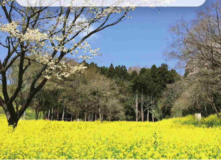
早春のひだまり広場

人びとの生活と活動の舞台になっている都市環境・自然環境をモノとココロの両面でより豊かで魅力的なものにするために、都市空間や景観のあり方とその実現方法を明らかにしていきたいと考えています。