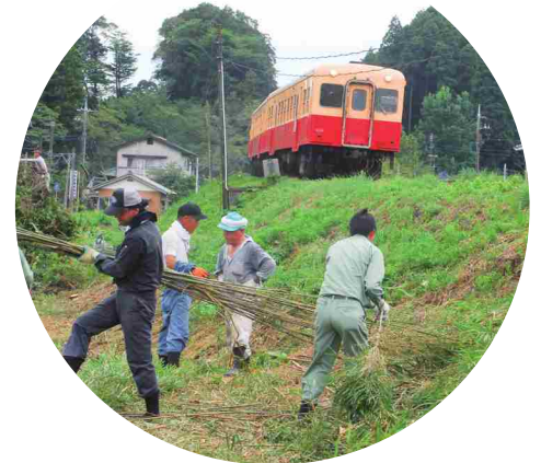
小湊鐵道周辺の景観を整備する 南市原里山連合の皆さん

申込み・問合せ先：NPO法人ちば市民活動・市民事業サポートクラブ(NPOクラブ)、市原米沢の森を考える会