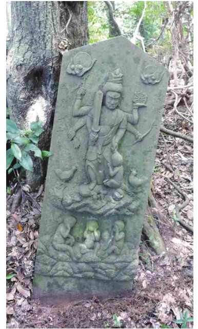
古道にある庚申塔