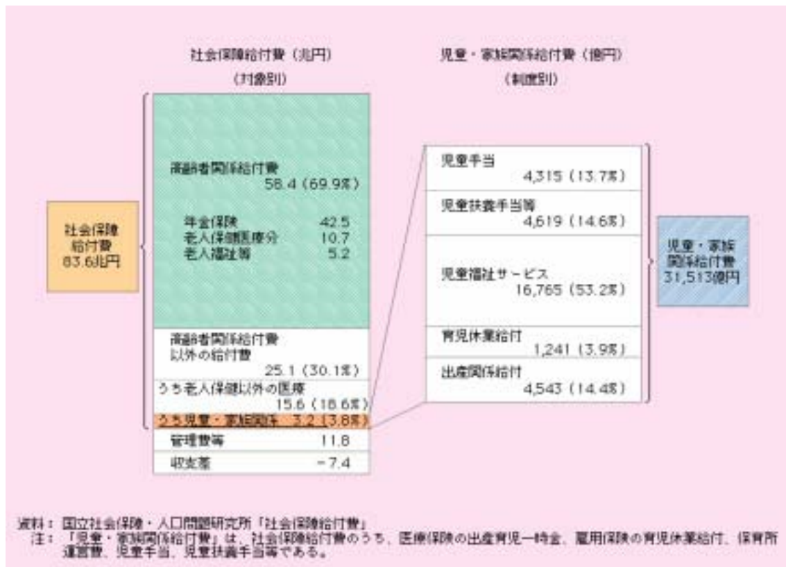
図 3 - - 1 社会保障給付費における児童・家族関係給付の位置（平成 14 年度）