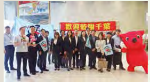
A visit from the staff in economic, labor, traffic division in Taoyuan