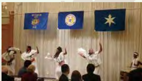
A performance by the African Dance Group アフリカダンスグループによる披露