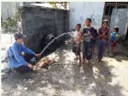
Children of Timor-Leste delighted to have running water 水道が出るようになり喜ぶ子供達

平成24年度から長期(1~3年)・短期(1~4週間)で県営水道の技術職員を派遣し、給水改善に向けた技術的な支援を行っています。