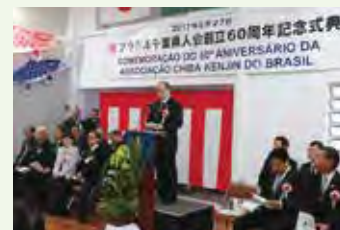
Congratulatory address from Chiba Prefecture 千葉県慶祝団による祝辞