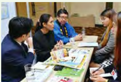
Business negotiations done at the booth ブースでの商談