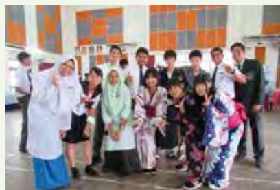
Various activities between the students 生徒同士で様々な取組を実施

千葉県では、タイ王国、シンガポールなどアジア各地において、観光客誘致、県産品の海外販路拡大に向けたPRを行っています。また、高校生、教職員をマレーシアに派遣して、現地での交流や体験等の実践的な活動により、参加生徒の異文化理解の促進、外国語によるコミュニケーション能力の向上を図っています。