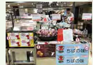
PR for Chiba's agricultural products 県産農産物のPR