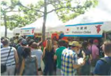
Chiba PR booth bustling with visitors お客さんと賑わう千葉県PRブース