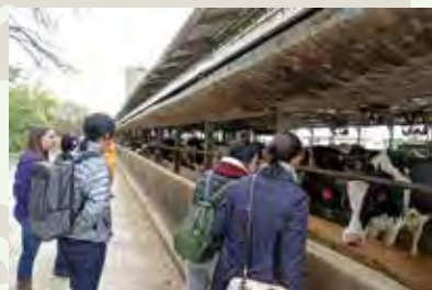
Making a visit to the cattle barn 牛舎の視察