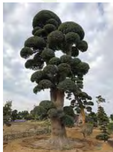
千叶县的花木在亚洲与欧洲各国很受欢迎。

千葉県は、江戸時代より続く梨の産地、恵まれた環境と長年蓄積された技術で、栽培面積、収穫量、産出額ともに日本一を誇ります。