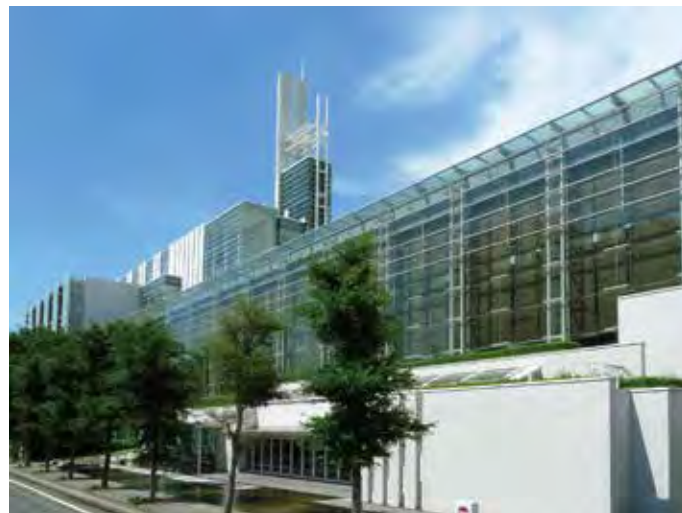
对生产产业集聚的东葛饰地区的中小企业与风险企业提供支撑的“东葛技术广场大楼”（柏市）

そこで、県では、「千葉県中小企業の振興に関する条例」や「第4次ちば中小企業元気戦略」に基づき、創業や発展など企業の成長段階に応じた継続的な支援、魅力ある地域資源の活用による企業の振興、人材確保や育成支援などにより、環境の変化に果敢に挑戦していく元気な中小企業を応援しています。