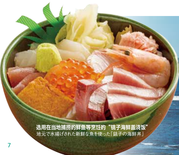
选用在当地捕捞的鲜鱼等烹饪的“桃子海鲜盖浇饭” 地元で水揚げされた新鮮な魚を使った「銚子の海鮮丼」