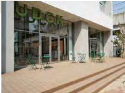
柏叶城市设计中心 柏の葉アーバンデザインセンター

作为智能发展基地,利用丰庶的自然与临近东京的便利性等优势,以产业、居住等功能和谐的“环境、健康、创造、交流之街区”作为主题,大学与地区积极合作,努力推进街区建设。