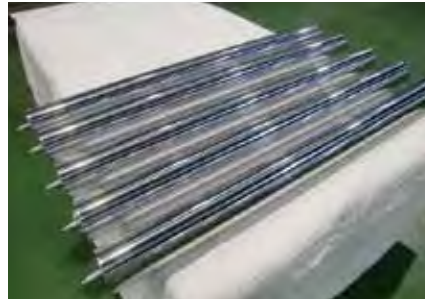
高性能碳纤维包层辊，用于改进为特薄薄膜的锂电池隔膜制造设备

特に薄いフィルムに改良した、リチウム電池のセパレーター製造装置向け高性能カーボンクラッドロール