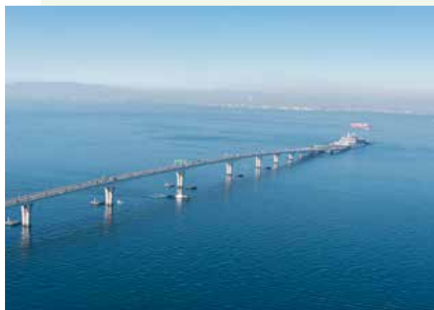
东京湾横断道路 東京湾アクアライン