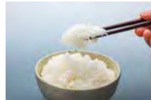
千叶县新品种 粒大口感好的“粒助” 千葉県新品種 大粒で食感のいい「粒すけ」

農業における食品の安全性などを確保する「GAP」の取組みを進めています。 また、農薬や化学肥料を通常の半分以下に抑えた「ちばエコ農産物」の認証など、環境にやさしい農業を推進しています。