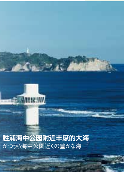
胜浦海中公园附近丰庶的大海 かつら海中公園近くの豊かな海