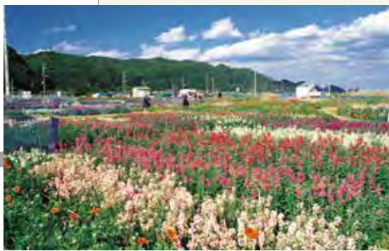
冬之南房総の花畑 冬の南房総の花畑

— 铁路 鉄道 — 高速公路、收费公路 高速道路、有料道路 ..... 规划 計画