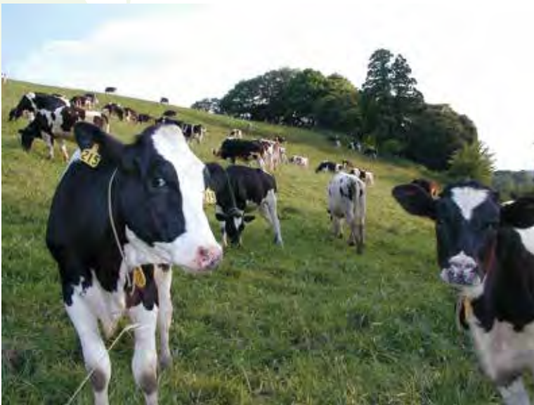
日本乳制品酪农的发祥地——千叶县，是日本全国屈指可数的酪农县。 日本の酪農発祥の地の千葉県は、全国有数の酪農県です。

江戸時代には、江戸に隣接していることから「江戸の台所」と呼ばれていた千葉県。日本の酪農の発祥の地でもあります。新鮮な食材は健康の源。成田空港から、千葉の高品质で安全・安心な農林水産物を世界にお届けします。