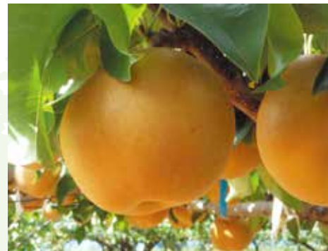
千叶的新品种梨子“秋满月” ちばの新しい梨「秋満月」

千叶县从江戸时代开始，就一直是梨子的产地，得天独厚的环境与长年积累的技术，使得千叶的栽培面积、收获量、产出额均在日本位居第一。