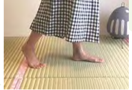
这种榻榻米不易打滑，便于行走，摔倒时也可以吸收冲击从而降低风险。