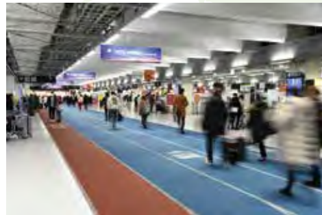
2015年投入运营のLCC専用第3航站楼 2015年オープンしたLCC専用第3ターミナル