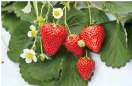
又甜又大的草莓新品种 “千叶草莓”

温暖な気候と肥沃な大地、豊かな海に囲まれた千葉県。農業産出額は全国第4位、県内漁港水揚げ金額は全国第8位など、全国有数の農林水産県です。落花生やダイコン、ニンジンなどの野菜、なし、ピワ、いちごなどの果物や、イセエビ、海苔、イワシなどの水産物など多彩な食材の宝庫です。