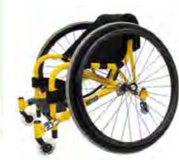
可以轻松开展体育活动的儿童运动轮椅

因此，本县根据“千叶县中小企业振兴的有关条例”与“第2次千叶中小企业活力战略”，按照创业与发展等企业的成长阶段提供持续的支援，利用有魅力的地区资源，对企业的振兴、人材确保与培养给予扶植等，对面对环境变化果敢进行挑战的、有活力的中小企业提供支援。