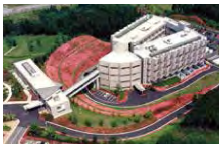
全球第一所DNA专业研究设施

かずさDNA研究所は、応用につながる高度な研究開発を行い、健康、医療、食品、農業などの幅広い分野で、研究成果の社会への還元に向けた取組を進めています。