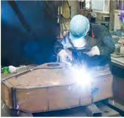
熟练的技术大显神通 熟練した技術が光ります