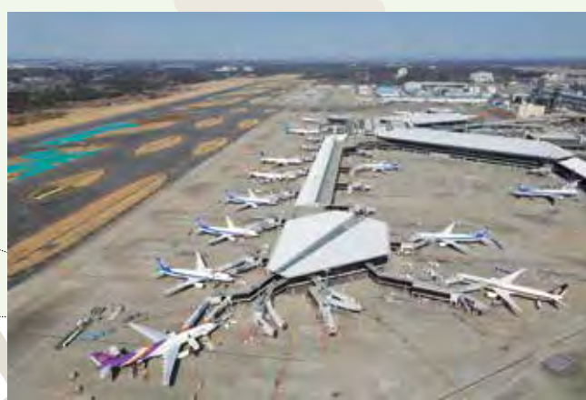
提供: 成田国際空港株式会社 提供: 成田国際空港株式会社 成田国際空港