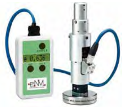
硬度试验机，只需简单的操作就能够精密测定各种物体的硬度

特に薄いフィルムに改良した、リチウム電池のセパレーター製造装置向け高性能カーボンクラッドロール