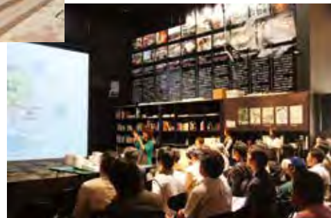
研讨街区建设的城市环境设计工作室 まちづくりを議論する都市環境デザインスタジオ

豊かな自然や東京からの近接性という利点を活かした知の拠点として、産業、居住などの機能が調和された「環境・健康・創造・交流の街」をテーマに大学と地域が連携して積極的にまちづくりに取り組んでいます。