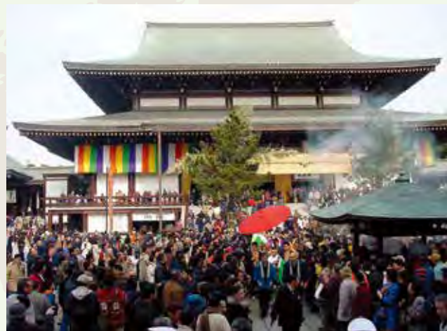
成田山 新勝寺 成田山 新勝寺