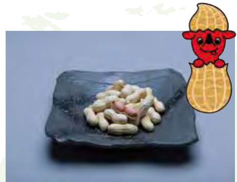
白色外壳、非常甘甜的花生“Q-nut” 荚が白く甘みが強い落花生「Qなっつ」