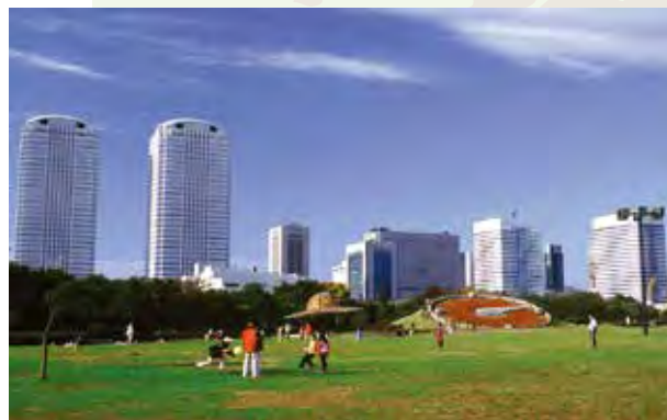
幕张新都心 幕張新都心