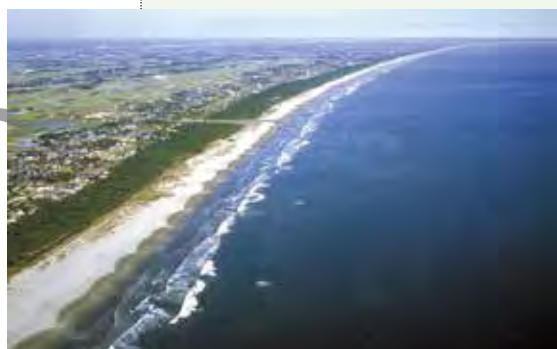
九十九里浜 九十九里浜