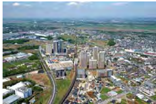
柏之叶校园站周边 柏の葉キャンパス駅周辺