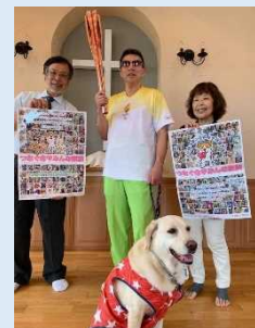
お世話になっている方々 & アイメイトと。

A.1：やはり聴覚が一番大切で、「音を見る」というイメージです。音を聞いて頭の中で描く感覚です。もしかしたら、ホラー映画を見て、実際の絵よりもすごくスケールの大きい恐怖を描いているかもしれません。(笑)ある映画がテレビで再放送されたときに「あれ、思ったのと違うな」と感じたこともあります。