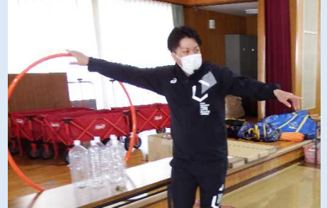
地域でのパラスポーツイベントを運営中

それらの状況から、子供からお年寄りまでが楽しめる環境づくりが、すぐそこまで来ていると思えました。今後は、これらのボランティア活動にも興味を持ち、出来ることから参加を始めてみたいと思います。(toshi)