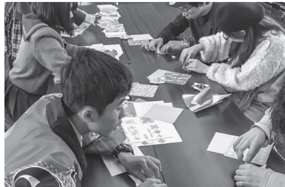
ゲストといっしょにコマづくり