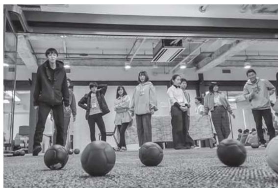
パラスポーツ体験：ボッチャ