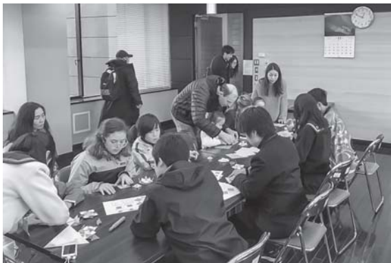
親子連れの参加者も