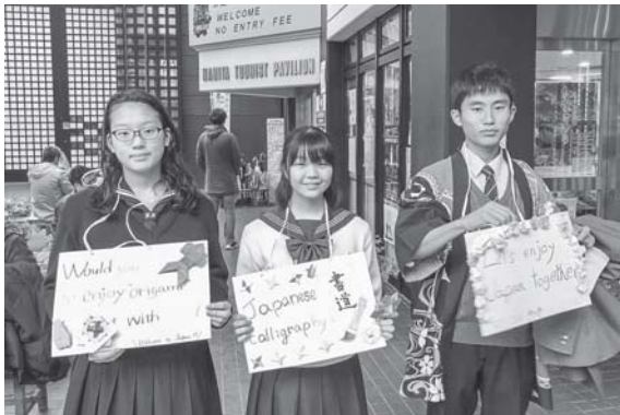
手作りのボードで外国人観光客に声かけ