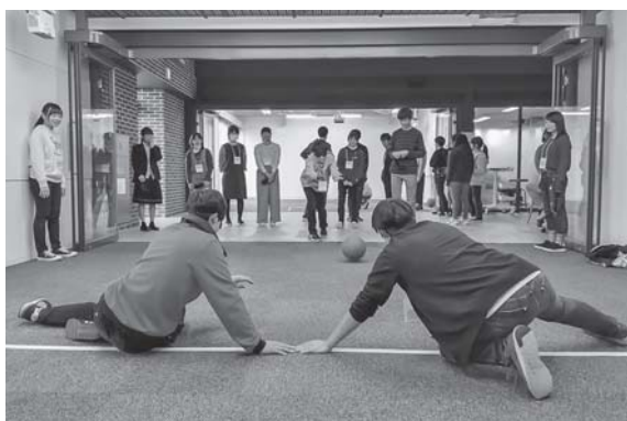
パラスポーツ体験：ゴールボール