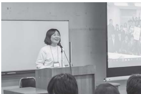
学生団体おりがみの紹介