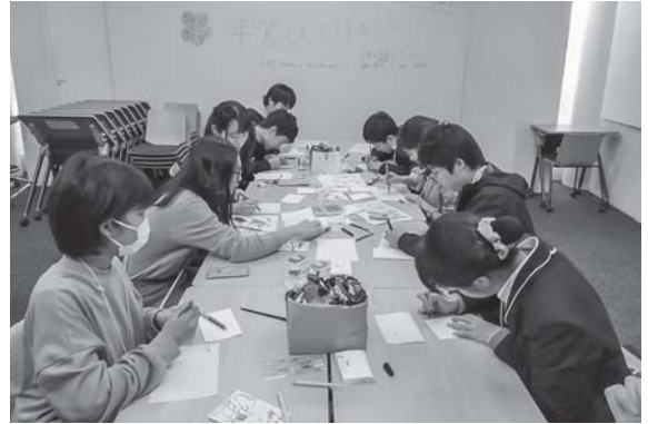
日本文化体験：ペン習字&年賀状作り