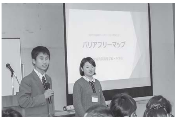
事例発表を行う高校生3