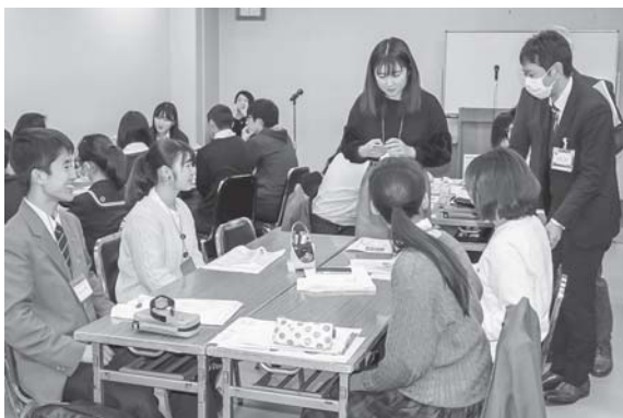
グループワークの様子1