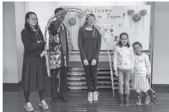
手作りの歓迎ボード、玉すだれと一緒に記念撮影