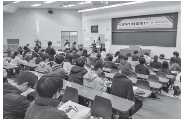
ボランティアトライアルの感想を発表