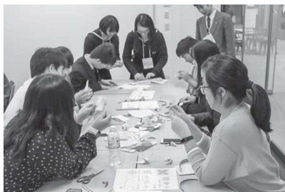
日本文化体験：おりがみ&箸置きづくり