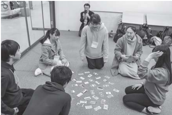
日本文化体験：国旗かるた遊び