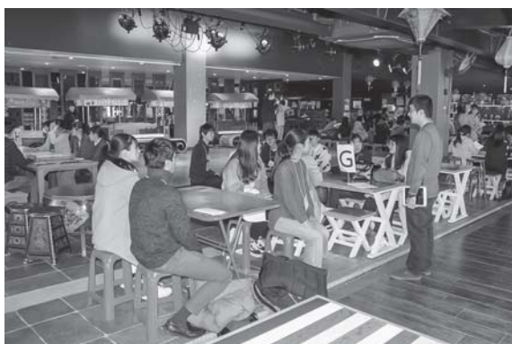
グループワーク：大学生リーダーを中心に