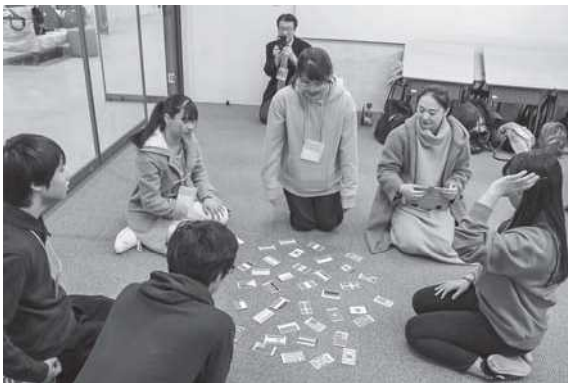
日本文化体験：国旗かるた遊び