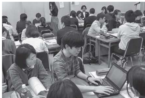
グループワークの様子2