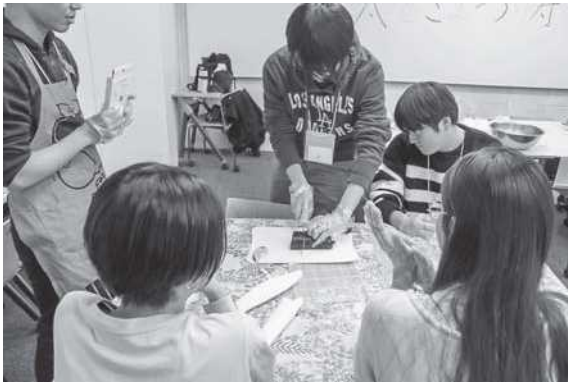
日本文化体験：太巻き祭り寿司体験