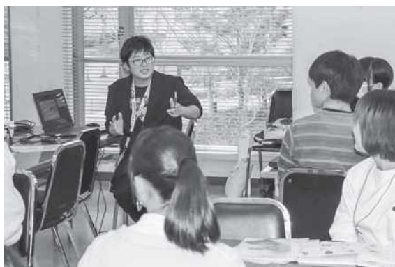
事例発表を行う高校生2