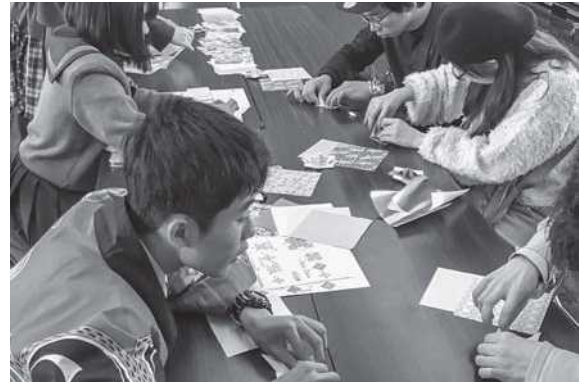
ゲストといっしょにコマづくり