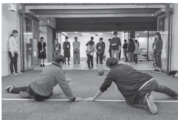
パラスポーツ体験：ゴールボール