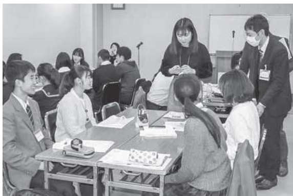
グループワークの様子1