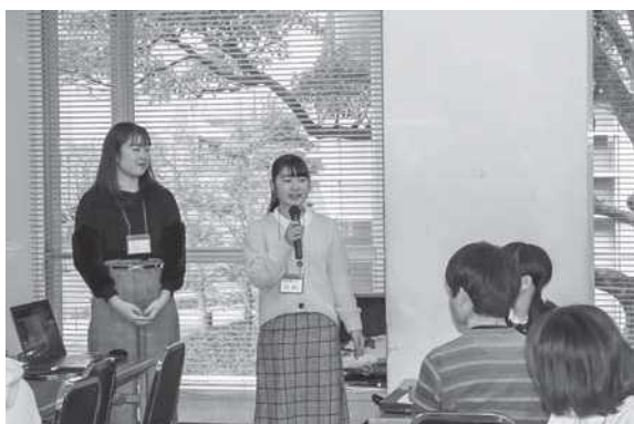
事例発表を行う高校生1