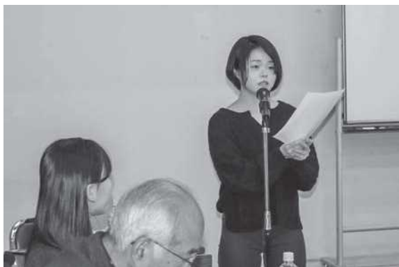
司会を務める大学生