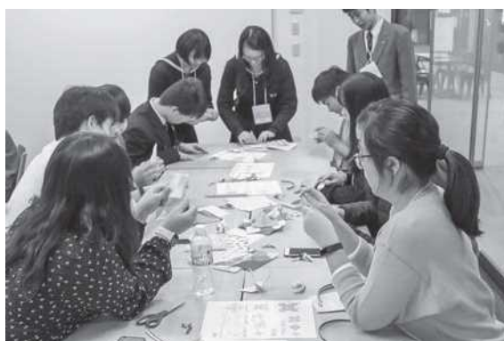
日本文化体験：おりがみ&箸置きづくり