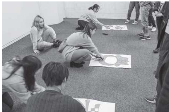
日本文化体験：福笑い遊び