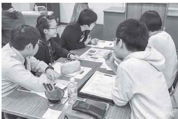
グループワークの様子3