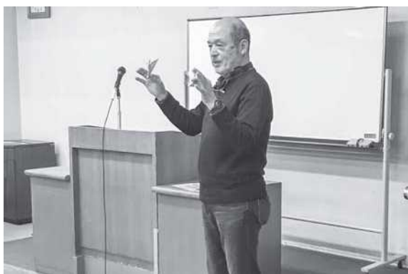
市原市ボランティアグループからの取組み説明