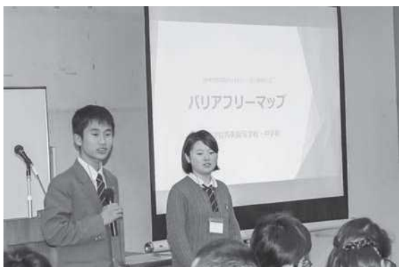
事例発表を行う高校生3