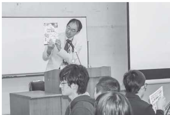
主催者あいさつ：千葉県