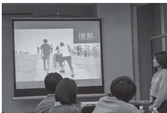
パラコネット事業の紹介：学生団体おりがみ