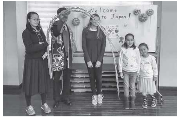
手作りの歓迎ボード、玉すだれと一緒に記念撮影