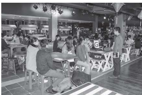
グループワーク：大学生リーダーを中心に