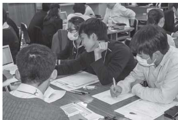
グループワークの様子4