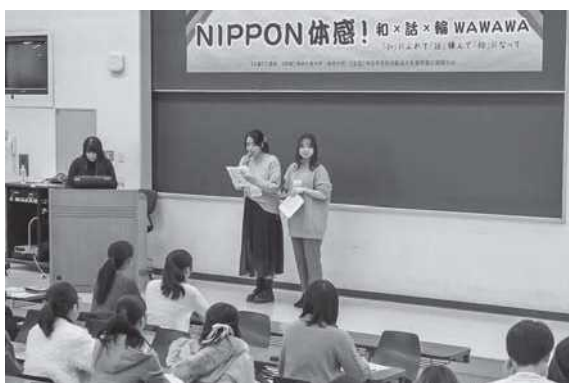
司会・進行役の神田外語大学学生のお二人