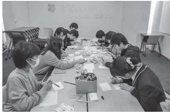
日本文化体験：ペン習字&年賀状作り