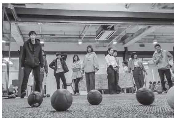
パラスポーツ体験：ボッチャ