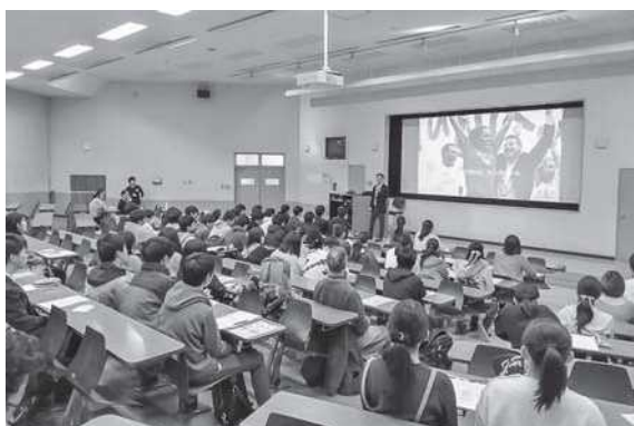
西川氏の講演を聞く参加者の皆さん