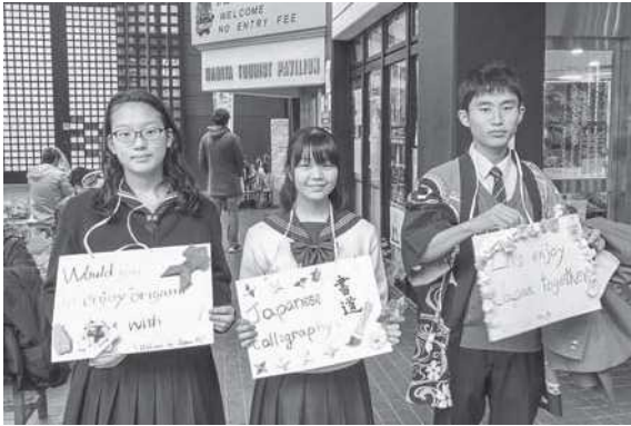
手作りのボードで外国人観光客に声かけ