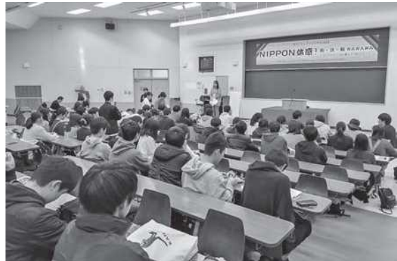
ボランティアトライアルの感想を発表