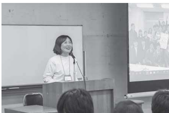
学生団体おりがみの紹介