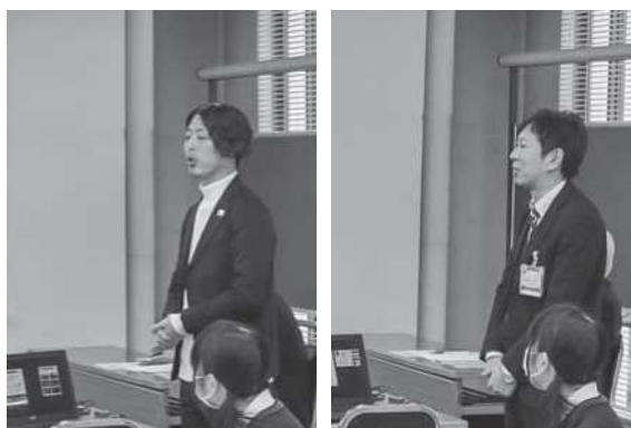
自治体からの取組み紹介：浦安市、市原市