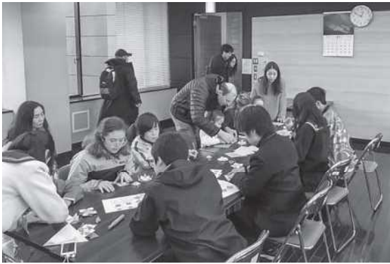
親子連れの参加者も